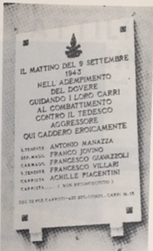
Lapide collocata in Piazzale Marsala in Parma, a ricordo dei carristi Caduti.

Nel centro del cortile si trovava un nostro M/15. Abbandonato forzatamente il progetto di usar-