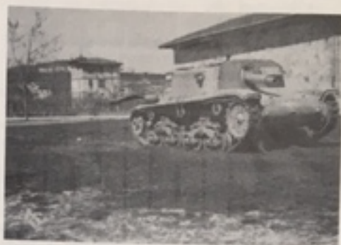
Semovente da 75/18