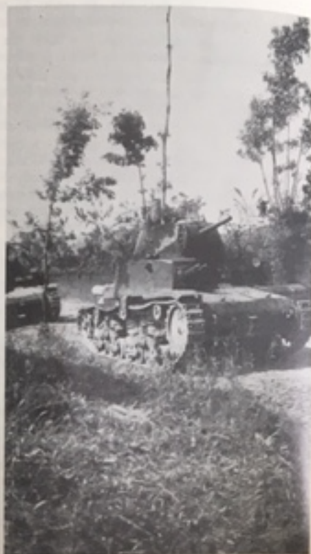
Carro M 13/40