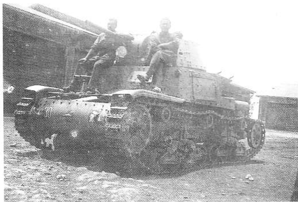
M 13 della Divisione Ariete