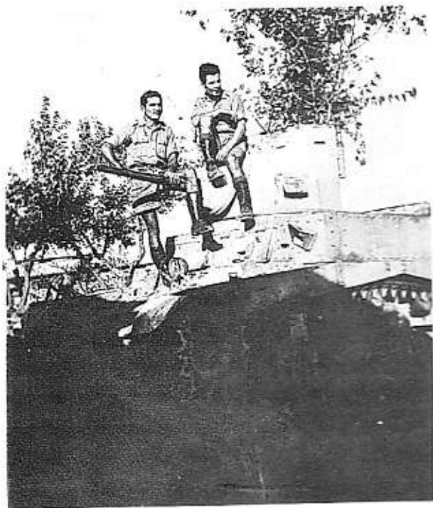
Recupero di un carro nemico