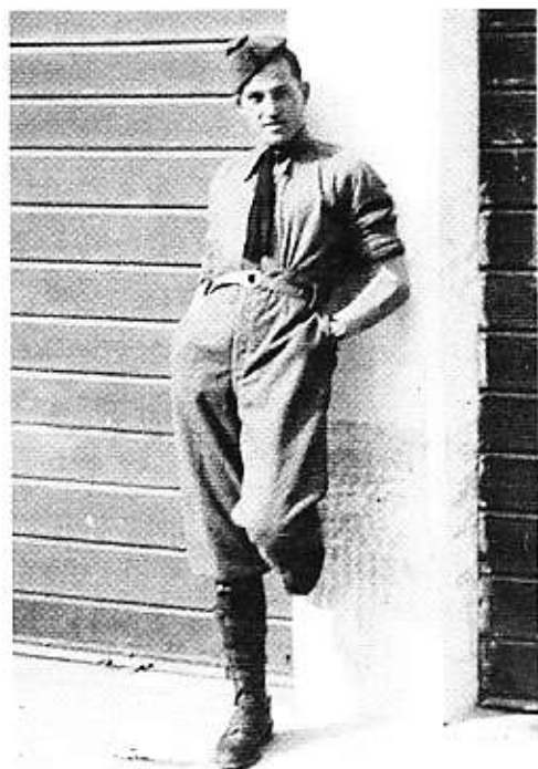
Cr. Ugo Lavoratorini caduto da eroe il 1 novembre 1941 sul fronte di Tobruk