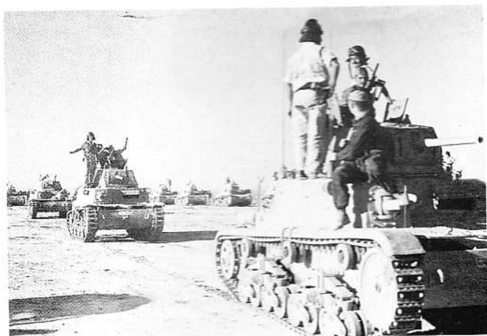
M14 della divisione Ariete dislocati nella zona di El Alamein