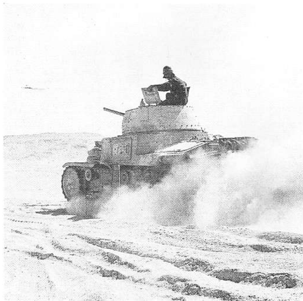
Un carro armato M14 in dotazione alla divisione Ariete

sa dove la abbia trovata mi fa strada. Il mio peregrinare prosegue da un reparto, sino alla piana di Bardia in una continua visione di strage e di morte.