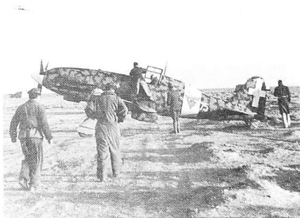
Un caccia italiano Macchi-202 pronto a decollare

Al richiamo dei comandi riprendemmo il lavoro interrotto.