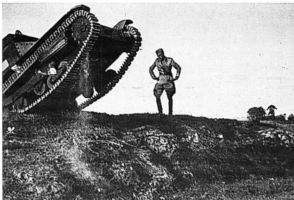
Bolzano - Campo ostacoli