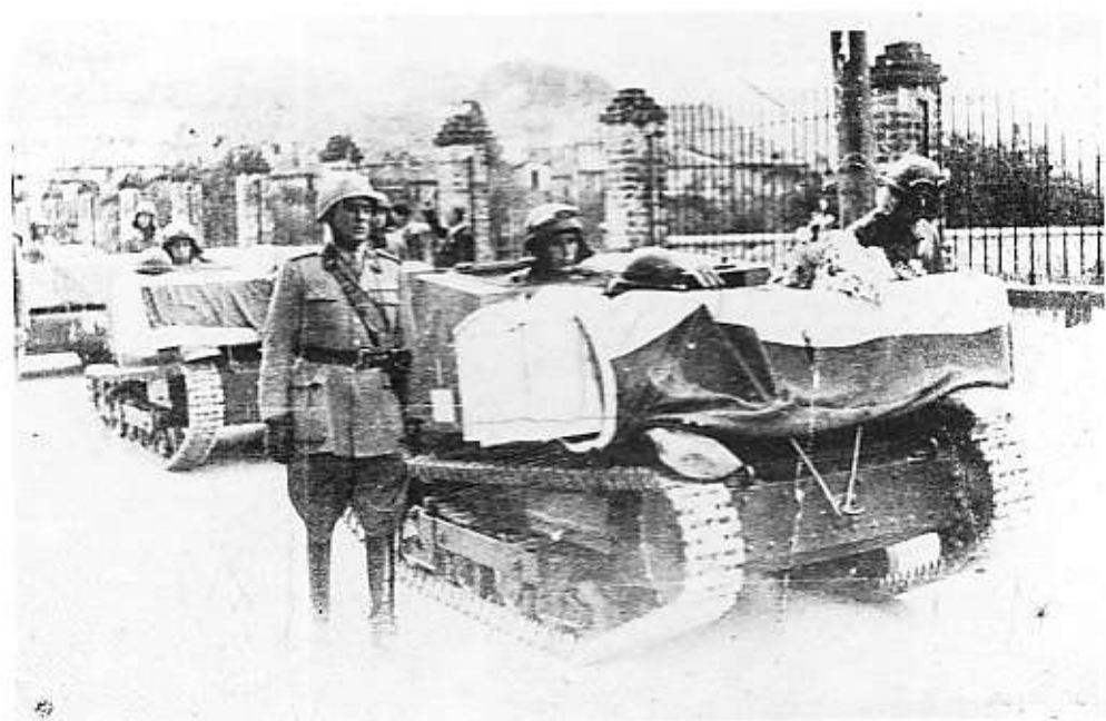
A.S. Sirte Fortino Maisier 4-2-1941

Fu la Morte di tanti Giovani in armi. Fu la morte di tanti inermi Civili. Io penso che tanta distruzione e Morte sia la colpa delle nostre idee e dei nostri istinti umani, che ci ha coinvolti tutti a non volersi bene. Io spero, mi auguro che ciò non avvenga più, che Iddio posi la sua mano sul capo di Colui o Coloro che domani vorrebbero di nuovo scatenare tanto Orrore.