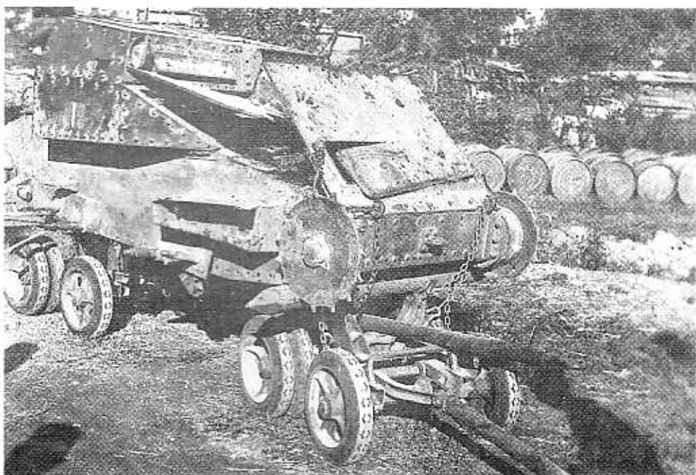
Recupero del carro di Bardasi dopo l'azione