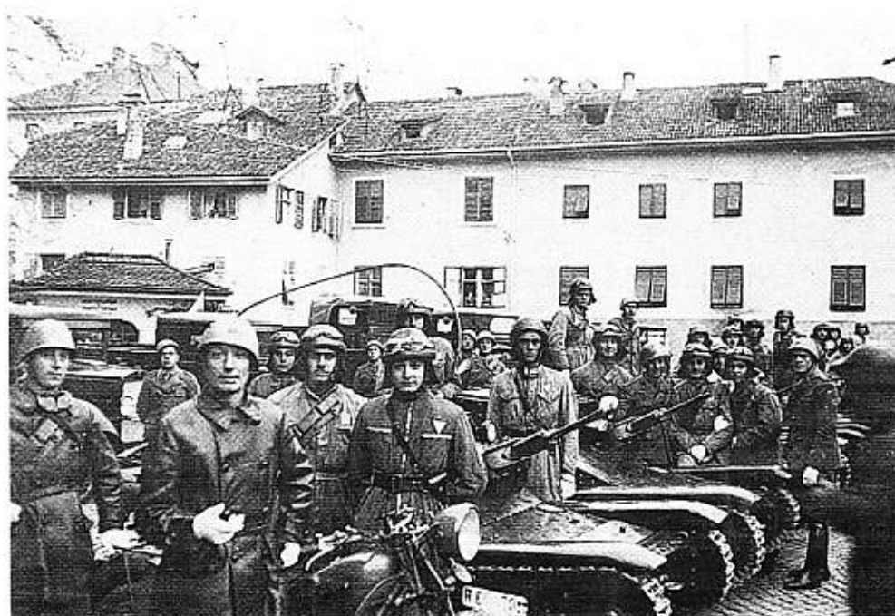
IV Brigata Carri di Bolzano