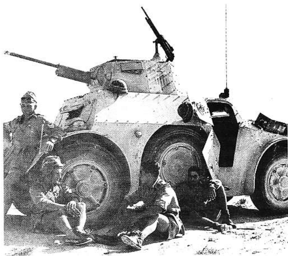
Autoblindo italiano in sosta in mezzo al deserto

sun risultato rimane ferito un solo uomo e per giunta leggermente. Ci si avvicina alla litoranea e si vede una colonna di almeno 10 Km di mezzi Italiani e Tedeschi che bruciano mi avvicino ma nulla da fare, sono talmente uno vicino all'altro che anche se non sono colpiti bruciano ugualmente. Il sergente da ordine di proseguire lo interpello personalmente e ci si confida siamo tagliati fuori. Andiamo ognuno per conto nostro, io porto circa altri 320 litri di benzina sono geloso e non do canestri a nessuno penso eseguendo il mio dovere di arrivare comodo a Marsa Matrù. Passo a fare controlli moto-