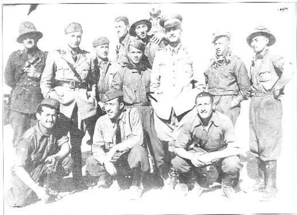
A.S. Sirte Fortino Maisier 4-2-1941