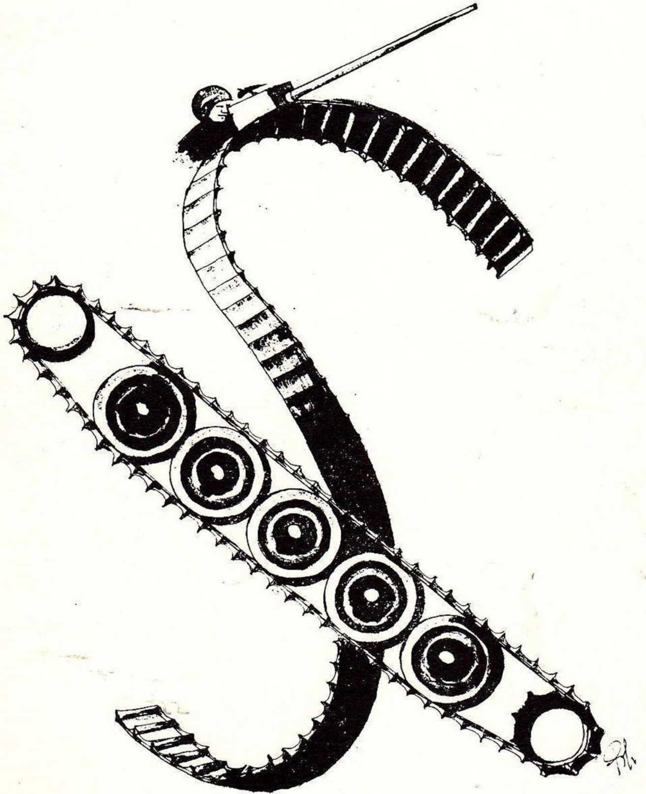
Crocevia di cingoli