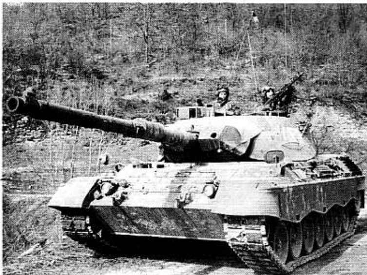
Uno dei carri Leopard 1A5 del 131° Reggimento carri schierati a Sarajevo nel 1995.

L'operazione "ALLIED HARBOUR" ha avuto inizio il 14 aprile: ad essa partecipano circa 1.500 uomini, tutti Volontari professionisti, della Brigata alpina "Taurinense" e del 6° Reggimento genio pionieri "Transimeno".