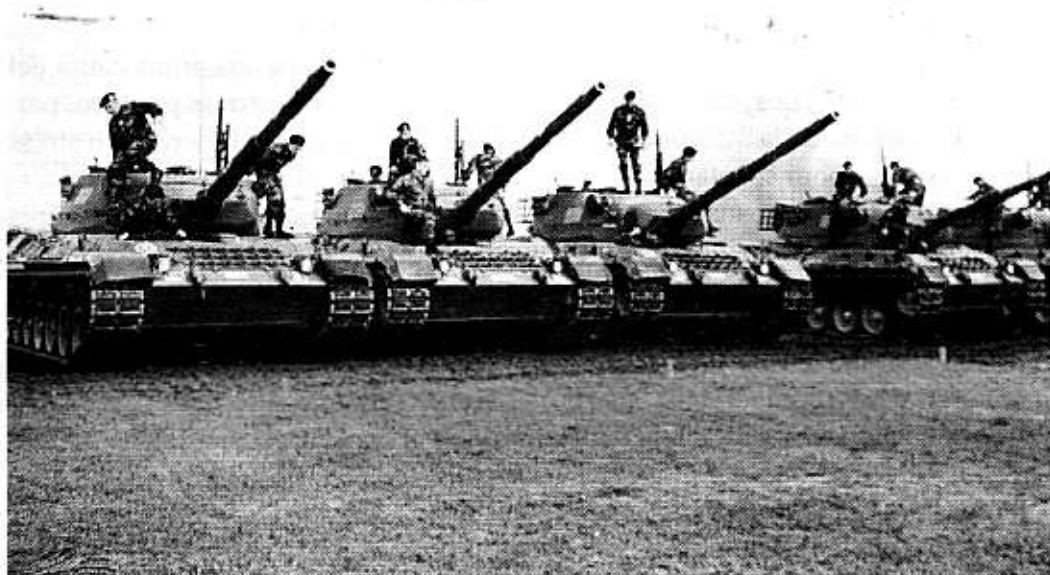
Carri armati "Leopard" del 4° Reggimento.

Eppure - per una volta - la realtà si è dimostrata molto più distesa, molto più serena di quanto da "fuori" si sentisse bisbigliare sul