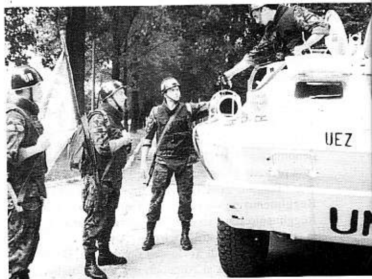
Militari impiegati sotto l'egida dell'ONU.

Apprezzamento che ha portato, dal marzo al luglio del 1997, all'affidamento all'Italia, per la prima volta dal dopoguerra, della direzione dell'operazione internazionale "Alba" in Albania grazie alla quale si sono potute celebrare regolari elezioni politiche nel Paese.