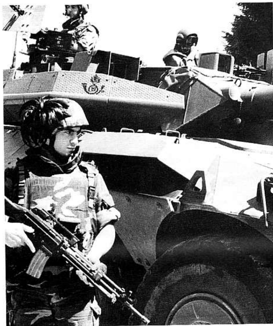
Bersaglieri del contingente di pace in Bosnia.

Nel recente passato, inoltre, l'Esercito italiano ha contribuito ad importanti operazioni per il controllo del territorio a sostegno dell'azione svolta dalle Forze di Polizia: l'esempio più eclatante è dato dall'operazione "Vespri Siciliani" che ha visto alternarsi sull'isola dal 1992 al 1998 oltre 150.000 soldati, in maggioranza militari di leva.