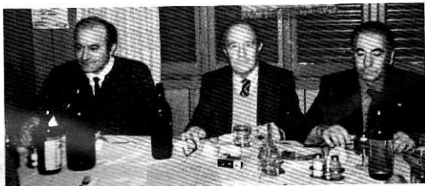
A DALMINE, CENA ROSSOBLU