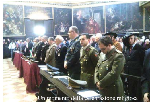
Un momento della celebrazione religiosa

Ciao Silvano "ferrea mole, ferreo cuore"