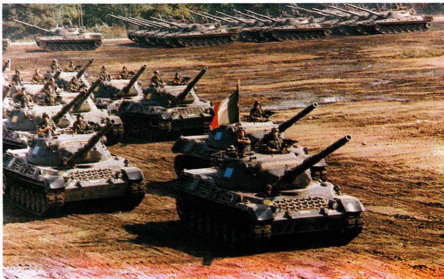
Nel nome glorioso della “CENTAURO”

1951 - ricostituzione del 31° reggimento