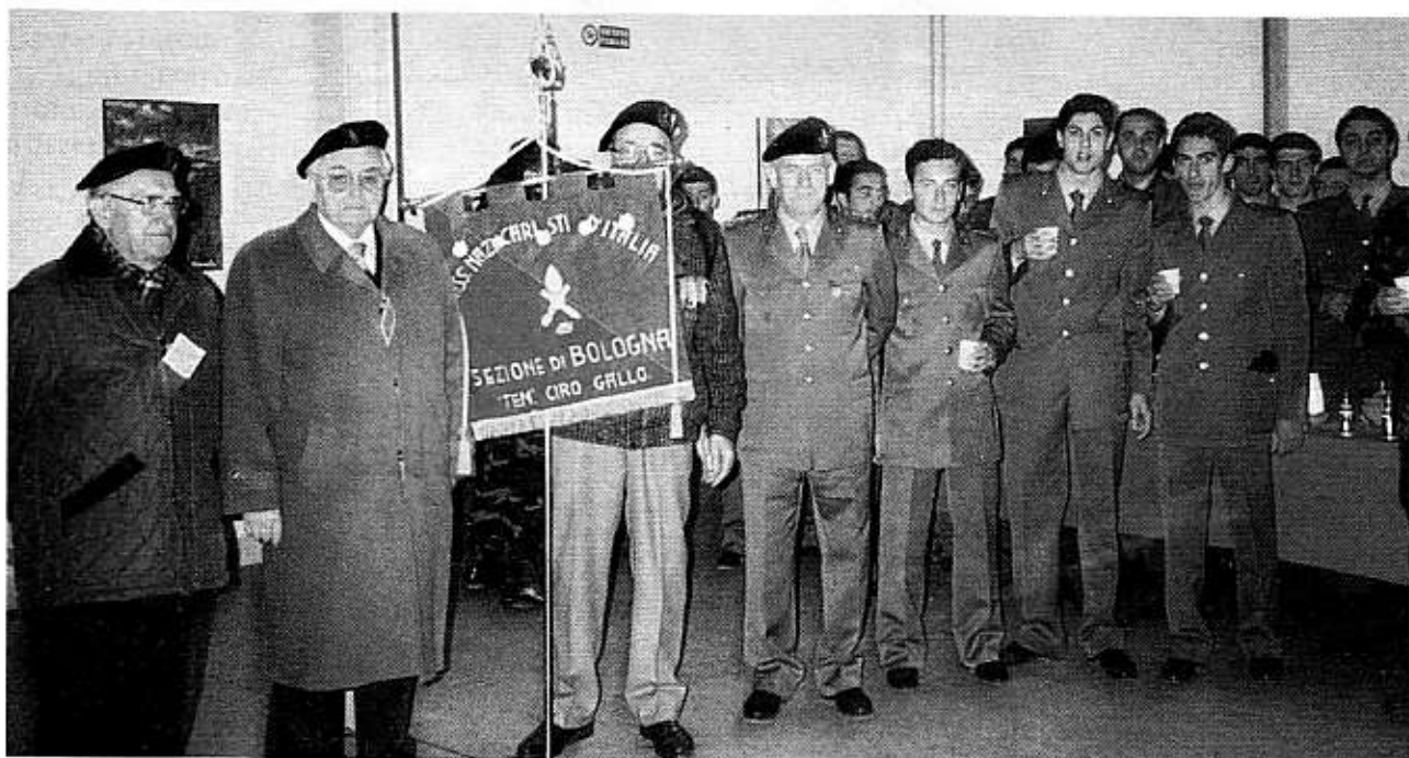
Ozzano Emilia, dicembre 1996. Incontro di fine d'anno alla Caserma Gamberini, sede del 33° Reggimento carri. Il direttivo della Sezione A.N.C.I. di Bologna con il Comandante ed alcuni ufficiali e sottufficiali del Reggimento.