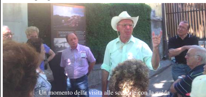
Un momento della visita alle scuderie con la guida