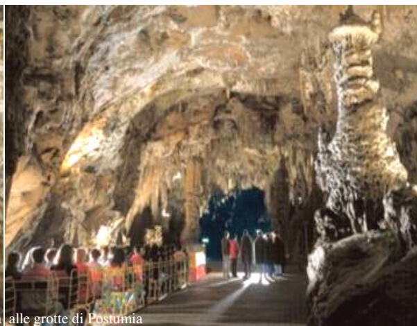
Alcuni momenti della visita alle grotte di Postumia