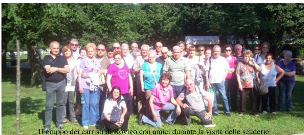
Il gruppo dei carristi di Rovigo con amici durante la visita delle scuderie