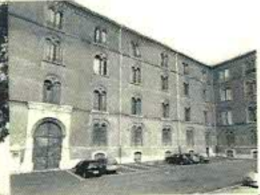
Caserma Garrone -Vercelli