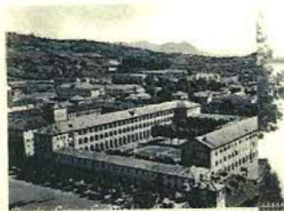
Caserma Fenulli -Pinerolo