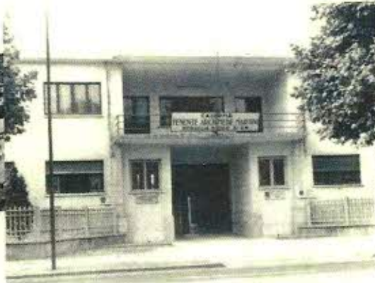
Caserma Martini -Verona