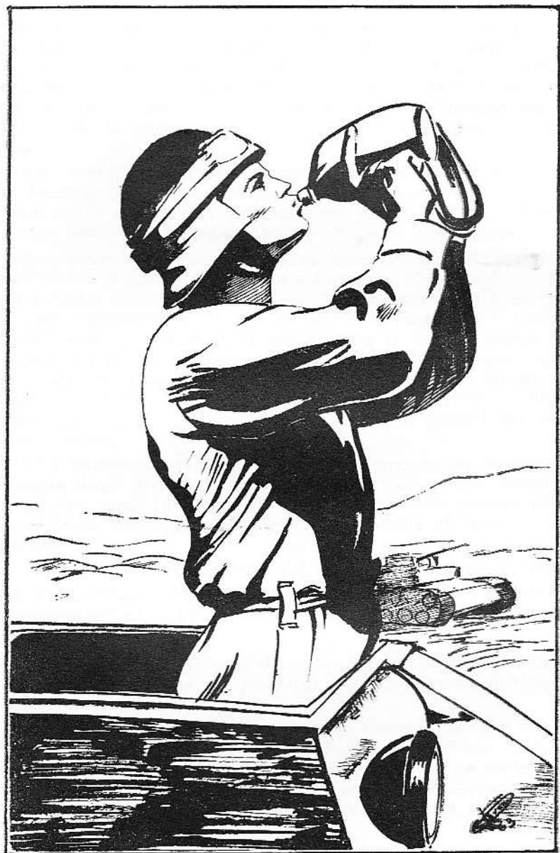
CARRISTA DEL DESERTO